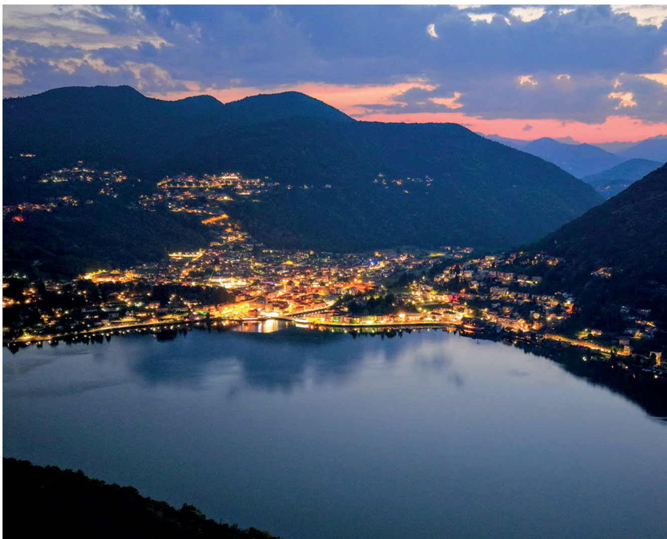
Ponte Tresa

Scatta una foto dello scorcio più interessante del tuo territorio e inviala a cancelleria@tresa.ch . Il contributo più originale verrà pubblicato sul prossimo numero.