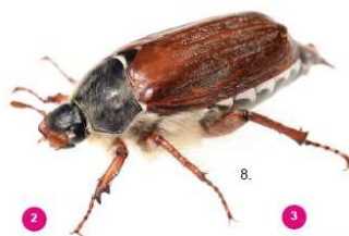
2 Melolontha melolontha Il comune maggiolino, 25-30 mm, non possiede ciuffi bianchi.