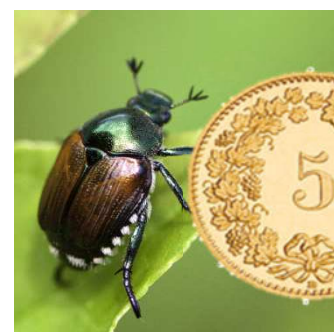
Figura 1: coleottero giapponese a confronto con una moneta da 5 cts.

Il coleottero giapponese ( Popillia japonica , Pj), classificato come organismo di quarantena prioritario, si distingue per la presenza di ciuffi pelosi bianchi (5 laterali e 2 più grandi nella parte posteriore) e per le sue piccole dimensioni, ovvero inferiori a una moneta da 5 cts (Figura 1). Esistono altri coleotteri molto simili coi quali ci si può confondere durante la determinazione. Nella Figura 2 sono illustrate le specie di insetti più comuni simili a Pj.