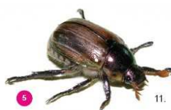
5 Mimela junii Il giugnino Mimela junii , 13-16 mm, possiede elitre di colore verde dorato e molti peli diffusi che non si distinguono in ciuffi bianchi. Ha una forma più ovale rispetto al coleottero giapponese.