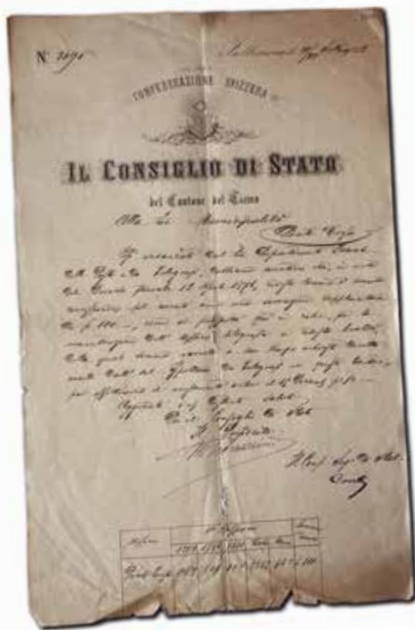
Lettera del Consiglio di Stato del 21/22 settembre 1882 con l'indicazione, fra l'altro, del numero di dispacci inviati dall'Ufficio telegrafico nel periodo 1879-1881.

compreso fra la fine del XVIII secolo e il XXI secolo. In una prima fase il lavoro di riordino si fonda su tre principi cardine, ovvero la messa in sicurezza dei documenti, la loro catalogazione e lo spurgo dei materiali senza valenza storica o amministrativa. In un secondo tempo viene allestito un inventario sistematico-cronologico (sia cartaceo che su supporto informatico) grazie al quale è possibile accedere in modo rapido e puntuale a tutta la documentazione conservata in archivio. Per ogni fondo verrà realizzato uno specifico inventario, suddiviso a sua volta in sezioni differenti in base alla tipologia dei documenti (ovvero documenti sciolti, registri e incarti). Al momento attuale ci stia-