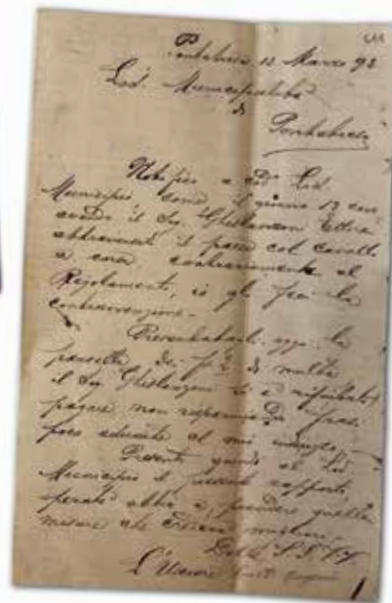
Lettera dell'Uschiere comunale del 13 marzo 1892 che comunica di avere multato una persona che ha attraversato "il paese col cavallo a corsa".