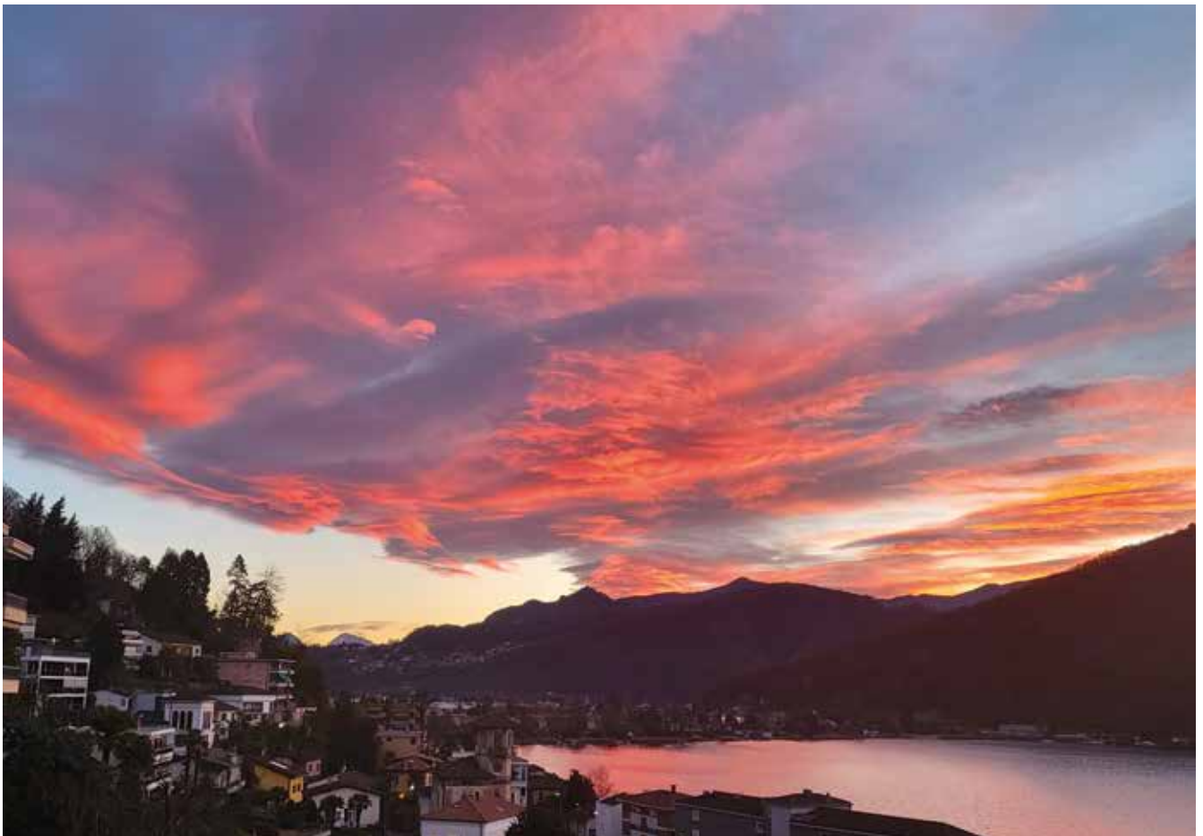
Via San Bernardino - Ponte Tresa

Scatta una foto dello scorcio più interessante del tuo territorio e inviala a cancelleria@tresa.ch . Il contributo più originale verrà pubblicato sul prossimo numero.