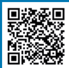
App Junker per iOS

Junker vi dà anche la possibilità di segnalare rifiuti abbandonati o sporcizia da raccogliere, graffiti o scritte da cancellare o cassonetti rotti. Così ogni cittadino può segnalare anomalie del territorio e aiutare il Comune a tenere pulito. L'ambiente è di tutti, insieme possiamo proteggerlo e curarlo.