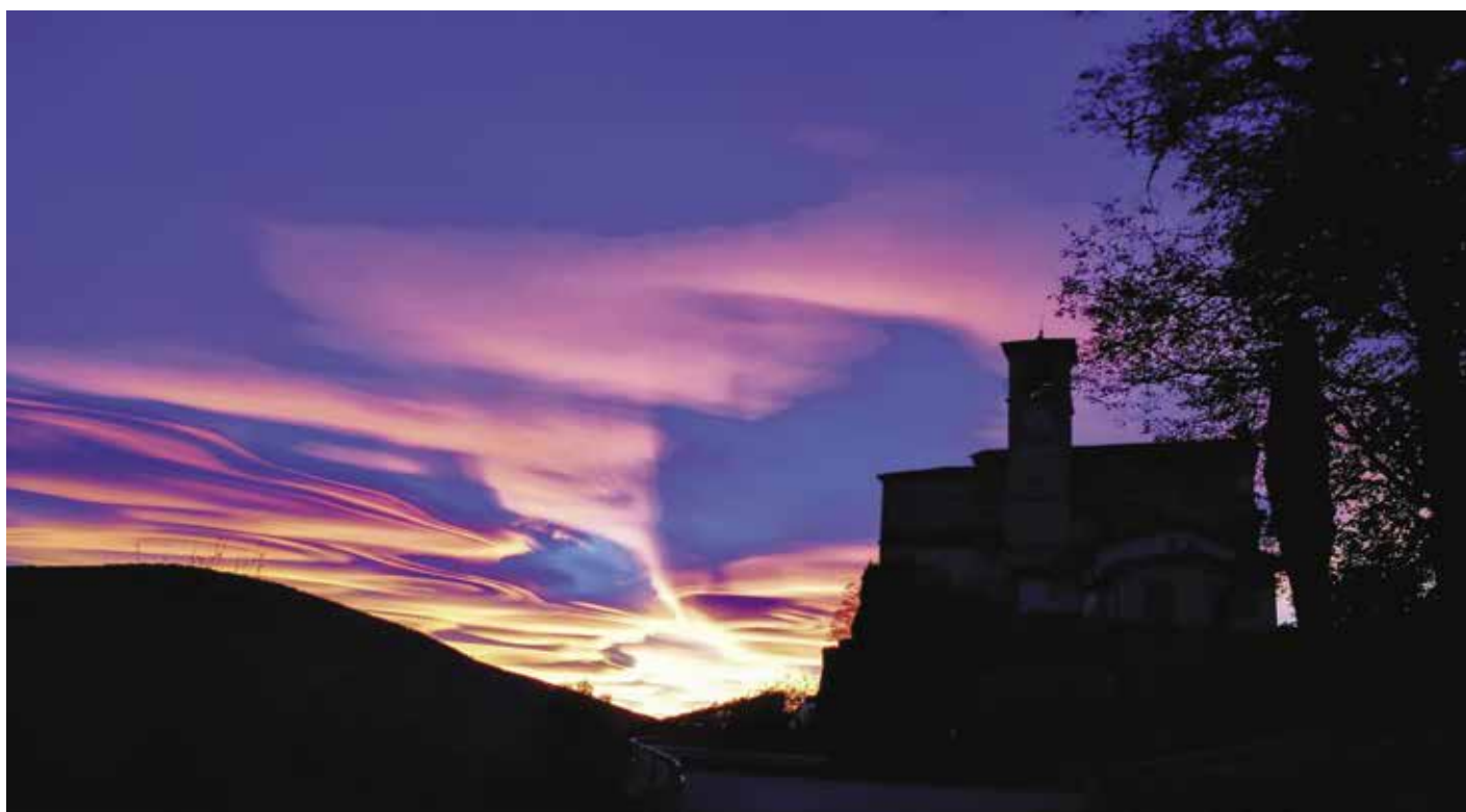
Campanile Chiesa di Castelrotto Quartiere di Croglia di Lorenzo Pozzi

Chiesa di Castelrotto - Quartiere di Croglia di Lorenzo Pozzi